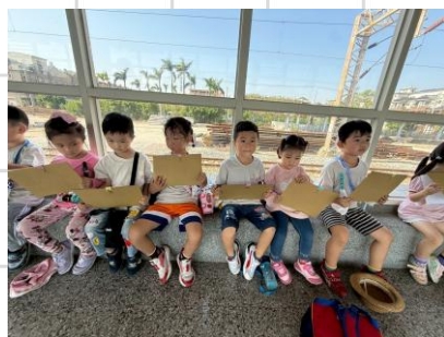
觀察火車並畫下火車的樣貌