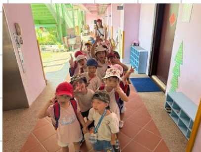
出發前往火車站囉！

在社區踏查路上，孩子們時常會看見火車，對火車產生興趣，因此我們一同前往「大肚火車站」近距離觀察火車，並畫下火車的模樣喔！